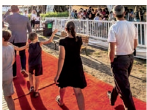
au croisement de la culture, du tourisme, de l'économie C'est contribuer concrètement à la relance collective du Québec matieres.ca/activites/retrouvezlartdici

Attendre? Non! Ils, elles sont une lumière qui, si nous marchons à leur côté, nous montre le chemin pour INVENTER la suite du monde!!! Go! Vous êtes à la bonne place pour les trouver! » - Christian Bégin, porte-parole du Salon des métiers d'art de Québec. Le public pourra rencontrer régulièrement Christian au détour des kiosques. Il présentera ses coups de cœur tout au long de l'événement et sera présent pour animer quelques de rencontres au Studio métiers d'art sur MATIERES.CA .